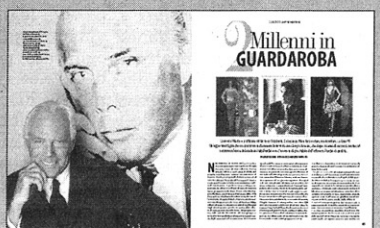
Giorgio Armani: lo stilista-imprenditore si racconta.

LA MODA? NASCE e si afferma nelle democrazie occidentali. La Cina? Un mercato importantissimo, ma il futuro del prêt-à-porter di alto livello è qui, in Europa. Il no-logo? Un fenomeno passeggero, una declinazione del conformismo. L'eleganza? Essere se stessi. Giorgio Armani, in un'intervista esclusiva pubblicata da Gentleman , fa il punto sul fashion-system e lancia una provocazione: «La moda non sa comunicare se stessa e i suoi valori positivi». Felipe di Borbone è invece il protagonista della seconda copertina del magazine che, all'interno, propone il meglio dell'art de vivre: da un viaggio nei magici riad del Marocco alla degustazione del Vin Santo, dalle auto alla moda alla nautica.