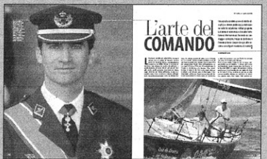
Felipe di Borbone: come si studia da re.