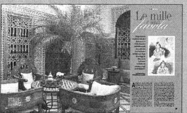
Viaggio in Marocco, sulle orme di Delacroix.